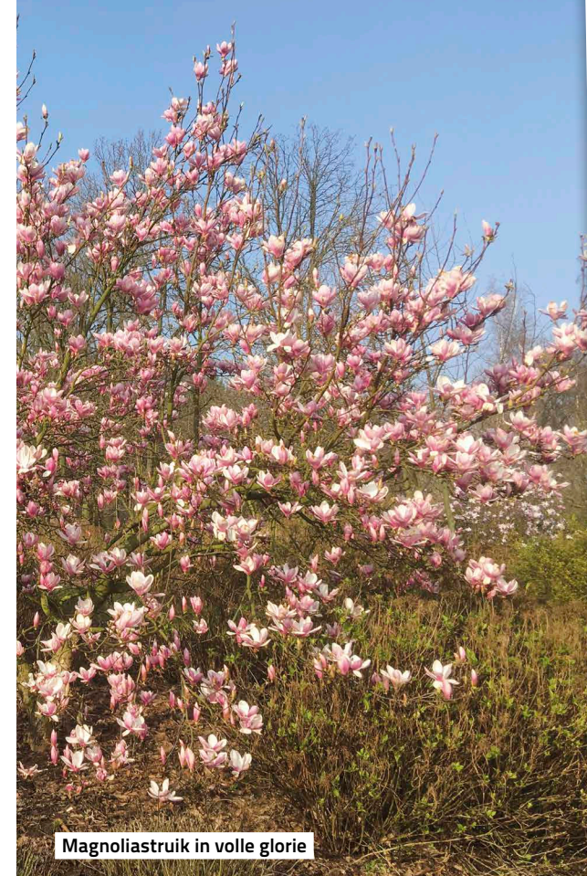
Magnoliastruik in volle glorie